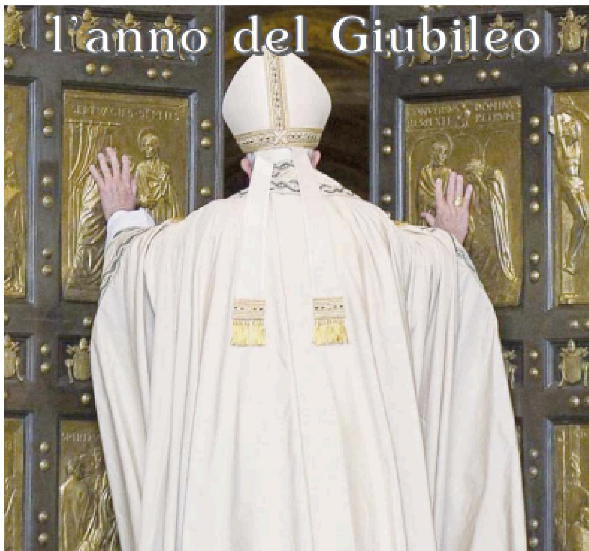
Roma, 8 dicembre 2015, papa Francesco apre la Porta Santa in San Pietro in occasione del Giubileo della Misericordia

Entra e vivi con noi l'anno del Giubileo